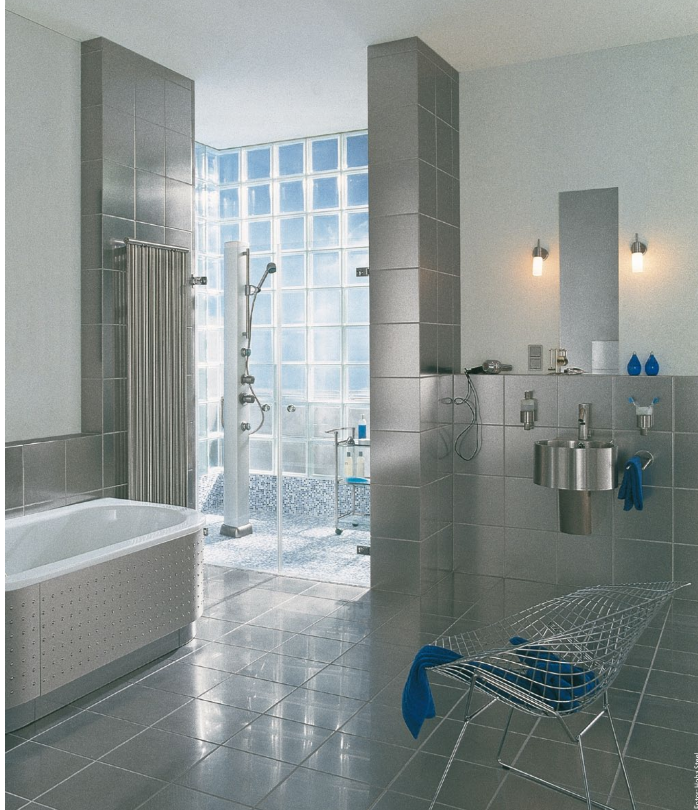
1 Mit „Spin“-Fliesen aus Edelstahl kann zum Beispiel ein stylisches Männerbad kreiert werden.