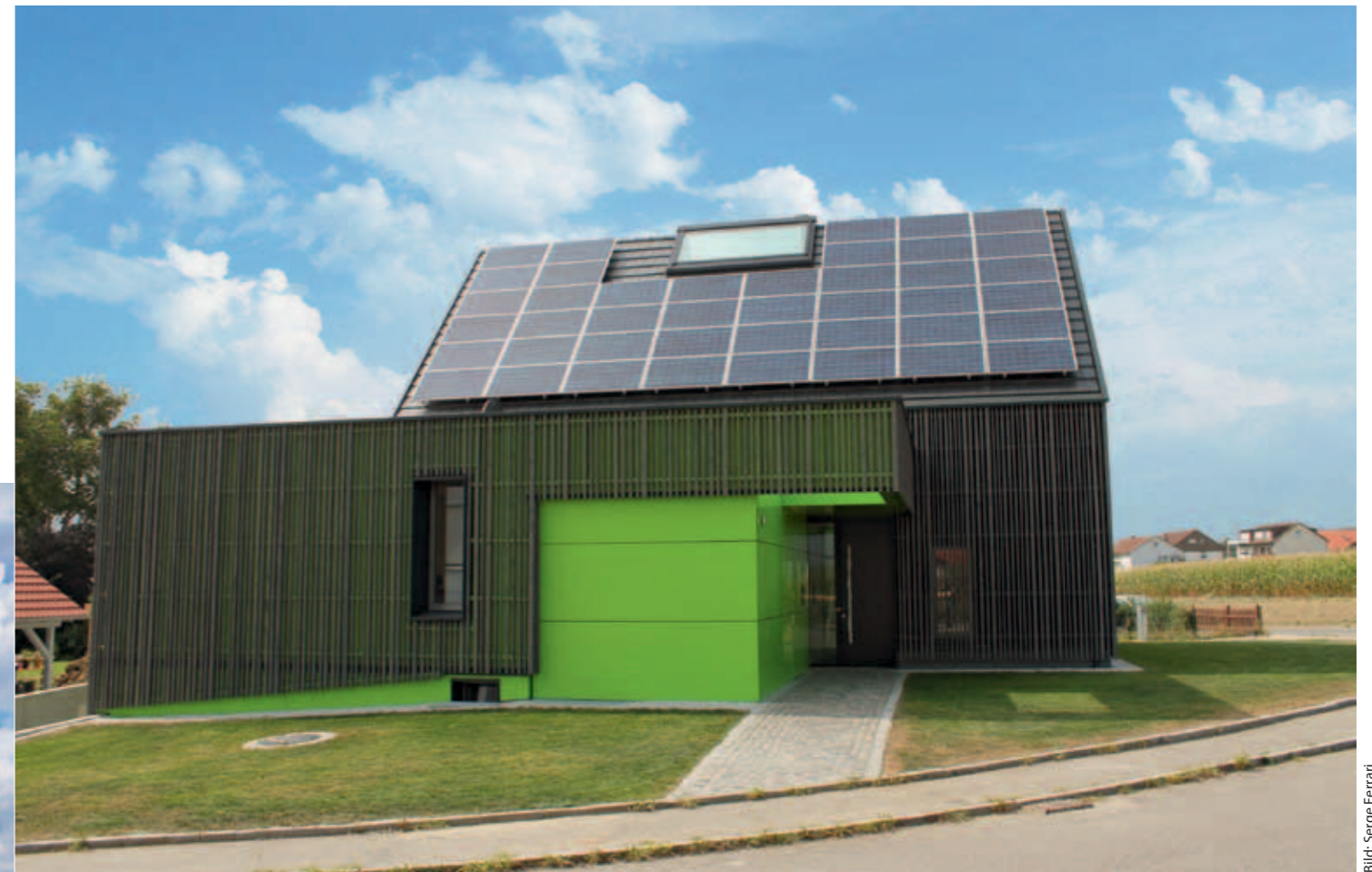
Farbe dient – neben dem Hell-Dunkel-Kontrast – auch an diesem privaten Wohngebäude in Ulm der Orientierung in unserer Umwelt.

Farbe dient – neben dem Hell-Dunkel-Kontrast – der Orientierung in unserer Umwelt. Farben benötigen keine Erklärung, sie