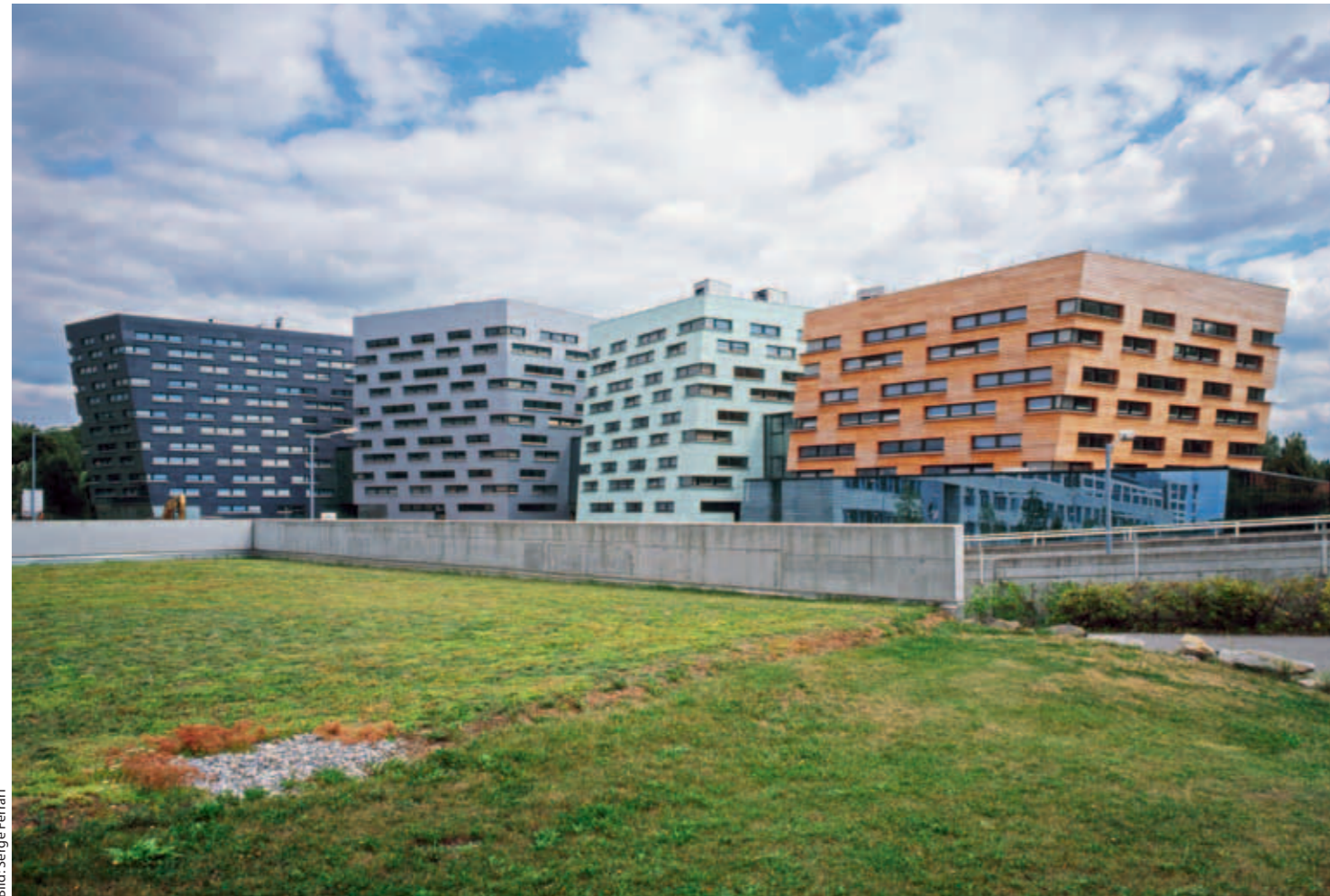
Die Farbwirkung hängt entscheidend von der Größe der farbigen Fläche ab, wie hier beim Wirtschaftszentrum N in St. Pölten. In der Regel sollte die Farbtintensität umso stärker reduziert werden, je größer die Fläche ist. Mit den Produkten Stamisol Color weiss und Stamisol FA konnte diese Anforderung gut umgesetzt werden.

Gestaltung | Die Welt ist voller Farben. Und jeder von uns hat eine Meinung zu Farben, hat Vorlieben und Abneigungen. Wäre es da nicht besser, auf Farbe in der Architektur zu verzichten, um größtmögliche Akzeptanz zu erreichen? Das ist nicht möglich, denn auch ohne farbige Behandlung hat jedes Baumaterial seine eigene Materialfarbigkeit. Wir „entkommen“ der Entscheidung über Farbe also nicht. Zudem übernimmt Farbe sowohl gestalterisch als auch funktional wichtige Aufgaben in der Architektur. Birgit Hansen